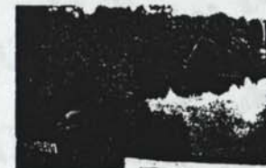
Biologischer Führer durch den Granitzer Park