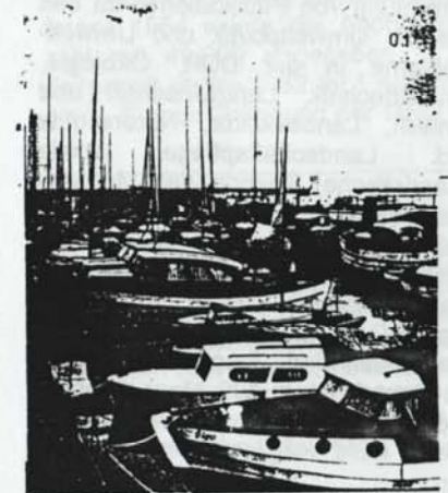
ARBEITSMATERIAL DER ZENTRALEN KOMMISSION NATUR UND HEIMAT DES PRÄSIDIARATES DES DEUTSCHEN KULTURBUNDES