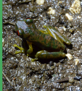
National Reserve Cabo Blanco