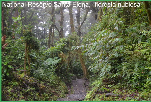
National Reserve Santa Elena, "floresta nubiosa"